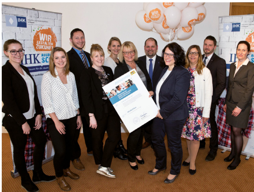
Die Regionalkoordinatoren freuen sich über die Verlängerung des Projektes um weitere 3 Jahre.

Die Regionalkoordinatoren sind die Ansprechpartner für Auszubildende, Unternehmen, Schulen und Öffentlichkeit vor Ort in den bayerischen IHKs. Sie akquirieren die Auszubildenden und Schulen, bereiten die IHK AusbildungsScouts in einem eintägigen Seminar auf ihre Aufgabe vor und vermitteln die IHK AusbildungsScouts an die Schulen. Bei den Besuchen in den Klassen sind die Regionalkoordinatoren nach Möglichkeit dabei.